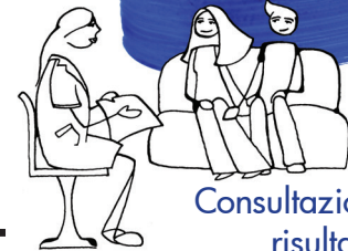
+ Consultazione dei risultati