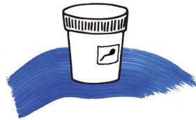
+ Seminogramma +